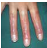
Na 2 maanden

Na wondsluiting Scarban siliconenverband + drukverband