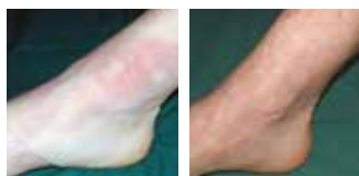
Na 3 maanden

Na wondsluiting Scarban siliconenverband + drukverband